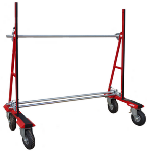
UPT 600 L. Nr. 70087